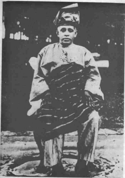
Sultan Abdullah, Sultan Pahang ke-3