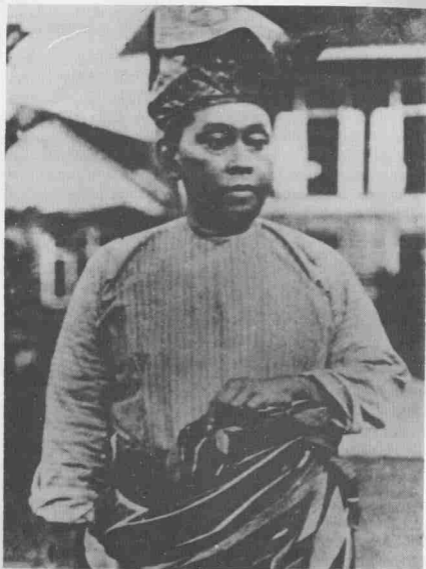
Sultan Mahmud, Sultan Pahang ke-2