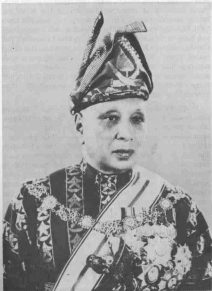
Sultan Abu Bakar, Sultan Pahang ke-4