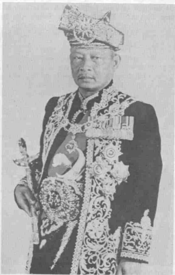
Sultan Haji Ahmad Shah, Sultan Pahang ke-5