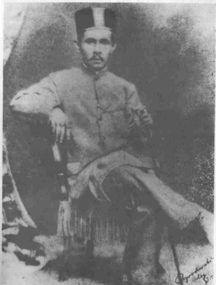
Sultan Ahmad, Sultan Pahang I